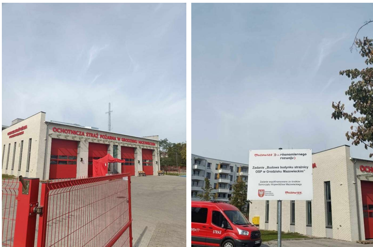
Rysunek 5. P.4.5 Budowa budynku strażnicy OSP w Grodzisku Mazowieckim wraz z zagospodarowaniem terenu oraz niezbędną infrastrukturą techniczną