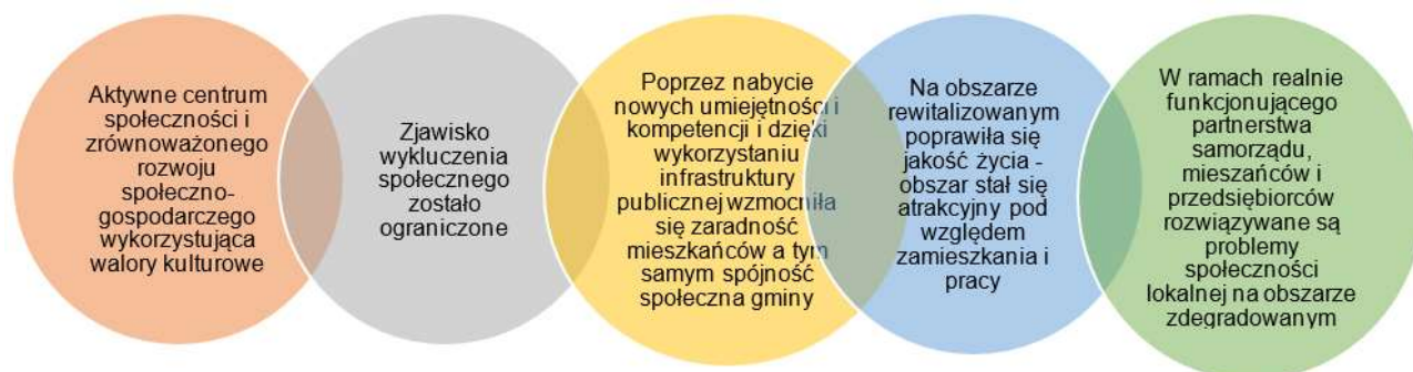
RYСУNEK 2 WIZJA OBSZARU REWITALIZACJI GRODZISKA MAZOWIECKIEGO UJĘTA W GPR 2021-2030

Sformułowane w Programie cele szczegółowe i przedsięwzięcia rewitalizacyjne miały realizować wizję obszaru rewitalizacji. W GPR ujęto ją w pięciu elementach: