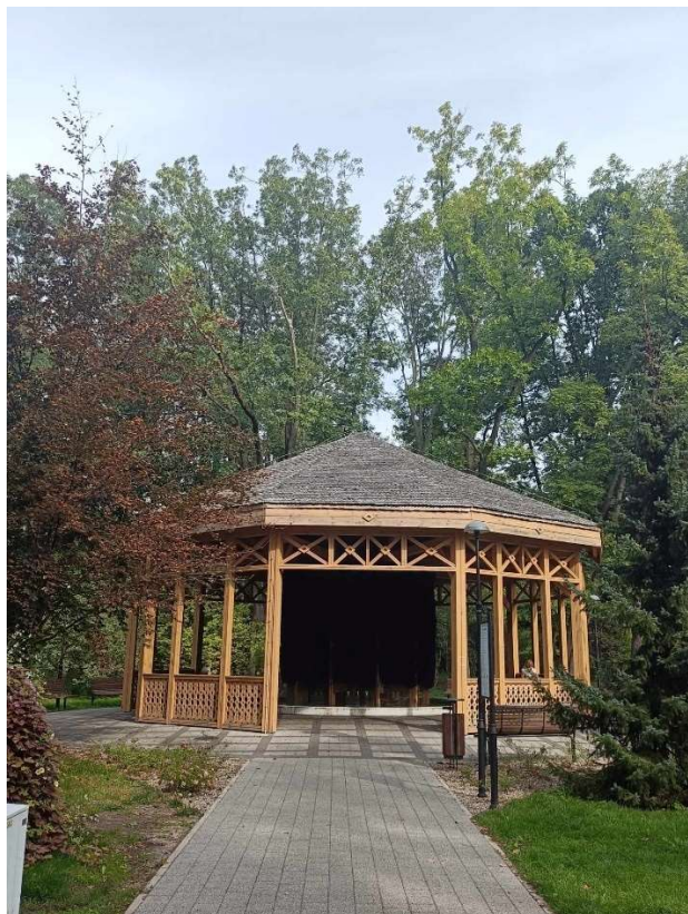
RYSUNEK 4. P.4.8. BUDOWA TĘŻNI SOLANKOWEJ WRAZ Z INFRASTRUKTURĄ TOWARZYSZĄCĄ W PARKU SKARBKÓW W GRODZISKU MAZ. NA DZ.NR EW.35/2 OBR,25