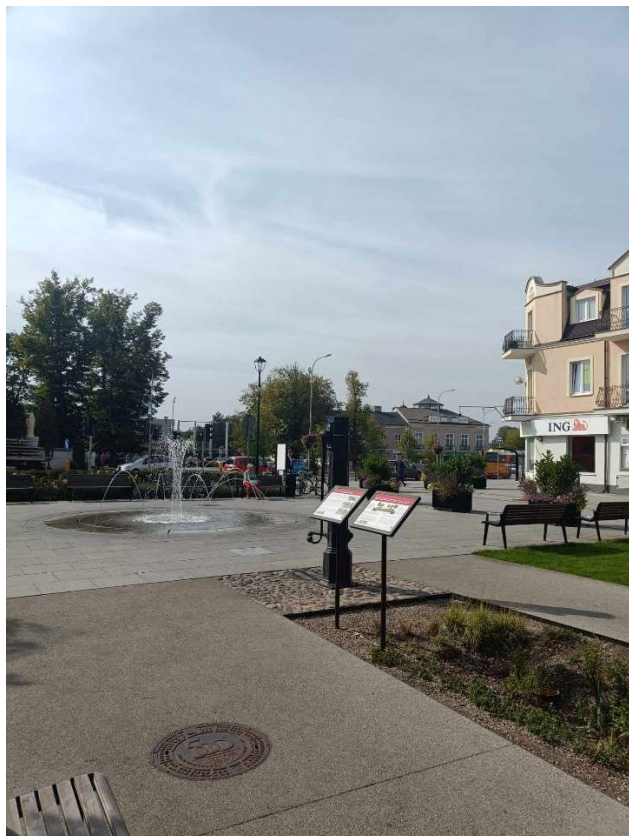
RYSUNEK 3. P.4.3. REWITALIZACJA TERENU NA PLACU WOLNOŚCI W RAMACH REALIZACJI ZIELONO-NIEBIESKIEJ INFRASTRUKTURY W GRODZISKU MAZOWIECKI.

Przed rewitalizacją powierzchnia nawierzchni utwardzonych i nieprzepuszczalnych wynosiła 3851m 3 co stanowiło 81,49% powierzchni całego placu Wolności. Powierzchnia biologicznie czynna wynosiła zaledwie 18,51%. Po rewitalizacji przeprowadzonej w 2022 r. powierzchnia nawierzchni nieprzepuszczalnych została zmniejszona do 2455m 2 , co stanowi 51,96% terenu. Powierzchnia biologicznie czynna wzrosła zatem do 48,04%, z czego 36,16% to tereny zieleni, a pozostałe 11,88% to nawierzchnie przepuszczalne. Na terenie placu zlokalizowano 4 niecki retencyjne z ogrodami deszczowymi oraz dwa zbiorniki podziemne do magazynowania wód opadowych o łącznej pojemności ponad 60 tys. litrów.