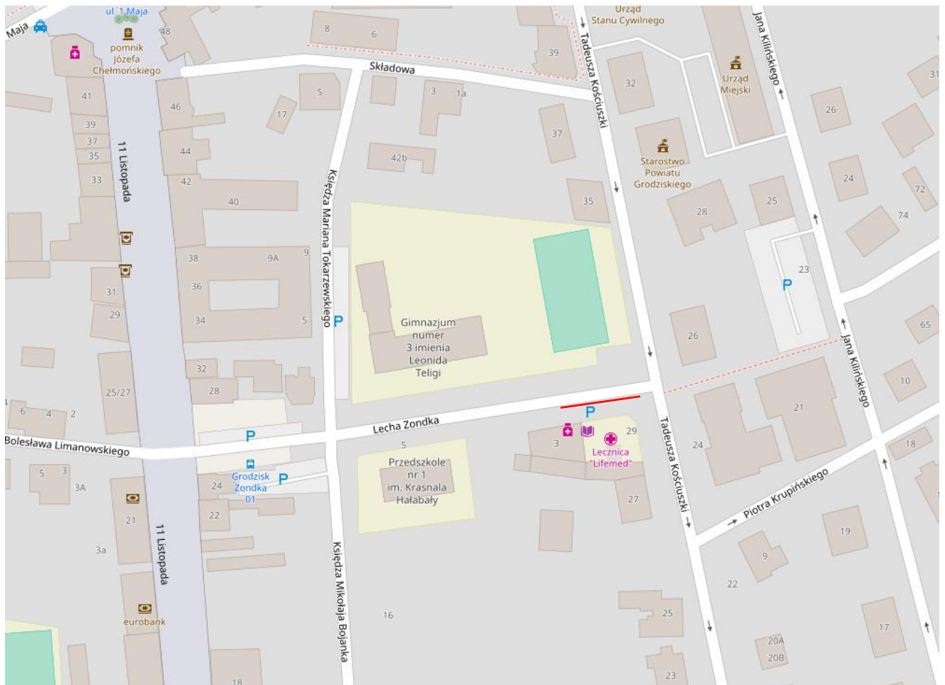
Plan orientacyjny Skala 1:20000

Ruch pieszych odbywa się po istniejącym dwustronnym chodniku.